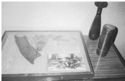
Обломки самолета и земля с места гибели Игашовцев

Некоторые скептики высказывают мнение, что, мол, столкновение самолетов если и произошло, то произошло случайно, а падение после столкновения было и вовсе непреднамеренным. Хотя, конечно, отрицать или