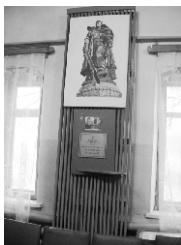
Музей Первинской школы