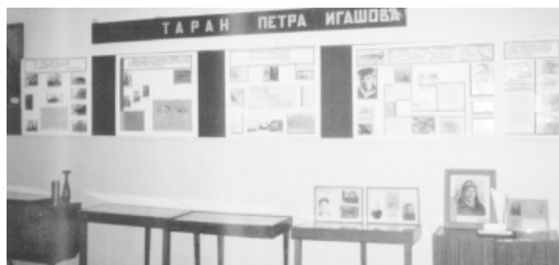
Под стеклом витрин.