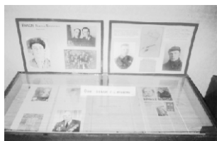
В музее Первенской школы