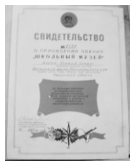
Музей Первинской школы