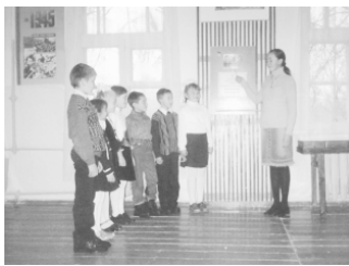
Учащиеся на экскурсии